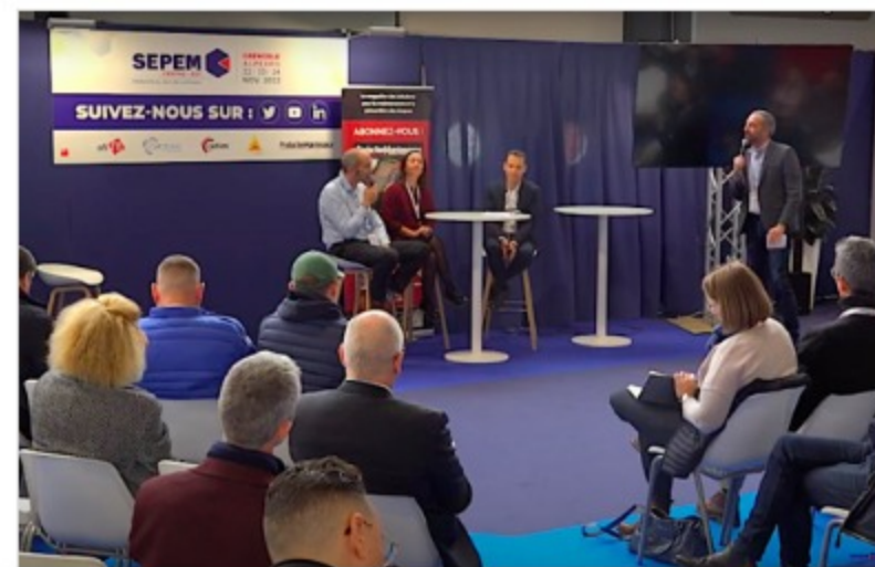
Table ronde « Industrie 4.0 » : Comment mettre en pratique l'industrie 4.0 et dans quel but ?

AVFC PRORÉFEI La formation des référents énergie dans l'industrie